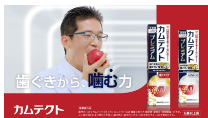
歯ぐきから、噛む力 カムテクト (カリッ)