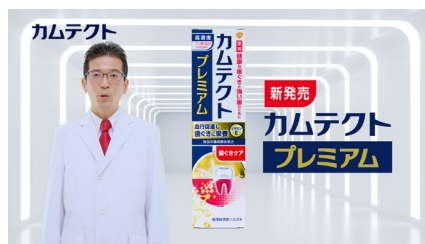
新カムテクトプレミアムは