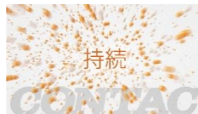
持続力で、ねらい撃ち