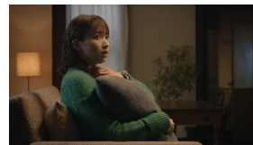
やだ、どうしよう・・・