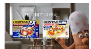
あなたのコンタック！